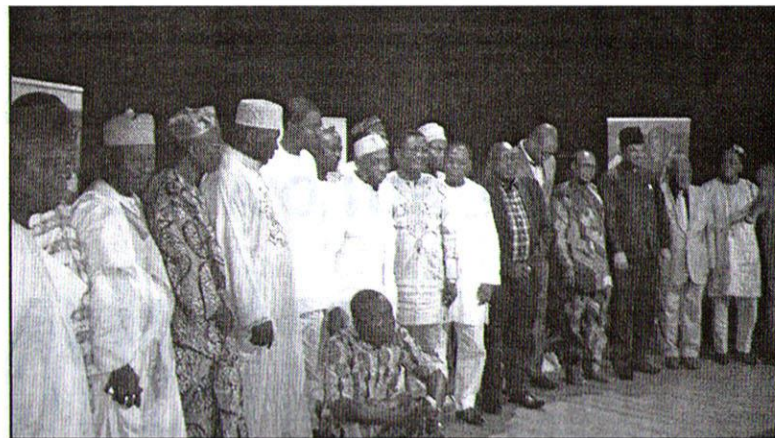
Photo de famille à l'issue du lancement de la pétition

couvents afin que soit recueilli le maximum de signatures au Bénin, en Afrique et dans le monde afin d'amener le Secré-