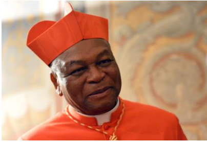
M. John Cardinal Onaiyekan , évêque puis archevêque d'Abuja depuis 1992