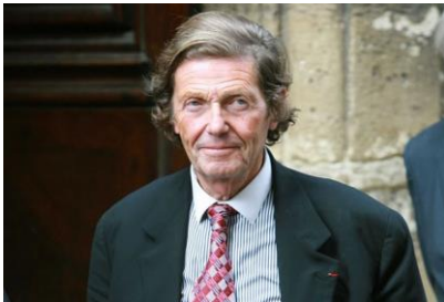
M. Olivier Stirn Membre de l'Académie des sciences d'Outre-Mer