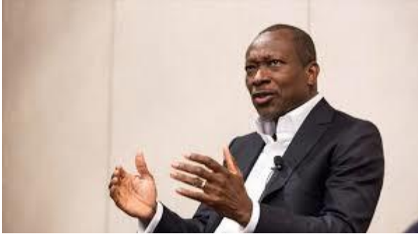
Le Président Patrice Talon (Bénin)

A la tribune dans le cadre de la pose de première pierre d'un centre de santé interconfessionnel devant servir de symbole à la réconciliation des fidèles de l'Eglise protestante méthodiste du Bénin, le professeur Albert Tévoédjrè a évoqué une nouvelle dynamique dans la conception du dialogue et de la paix.Pour lui, le dialogue doit se matérialiser par des actes concourant à l'amélioration de la vie des Hommes. «La foi sans les œuvres n'a pas de sens. Si nous disons dialogue, dialogue, dialogue et que nous n'allons faire rien, on bavarde. Alors disons, la paix, c'est la foi dans le dialogue qui produit quelque chose de concret pour changer la vie des hommes » a-t-il déclaré à Kpoguidi, un village de Sèmè-Kpodji dans le Sud-Est du Bénin. Pour cet ancien envoyé spécial de l'Onu en Côte d'Ivoire, cette nouvelle forme de conception de la paix et du dialogue est un exemple que le Bénin donne au reste du monde. « Voilà le nouveau chemin que le Bénin offre au monde entier. Dire désormais qu'il n'y a plus de programme de la paix qui ne doit pas comporter non seulement le dialogue, non seulement les droits humains proclamés, mais l'action, l'agir ensemble pour changer la vie des gens » a-t-il lancé. Il faut dire que la réconciliation des frères en Christ de l'Epmc après des années de discorde a été possible grâce à la médiation du Président Patrice Talon et du professeur Albert Tévoédjrè.