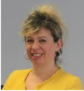
Mme Pascale Fressot Présidente de l'Alliance Internationale pour les Objectifs de Développement Durable (AIODM/AIODD)