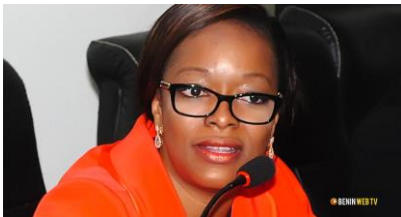
Mme Reckya Madougou , ancienne ministre du Bénin, experte internationale en finance inclusive et projets de développement