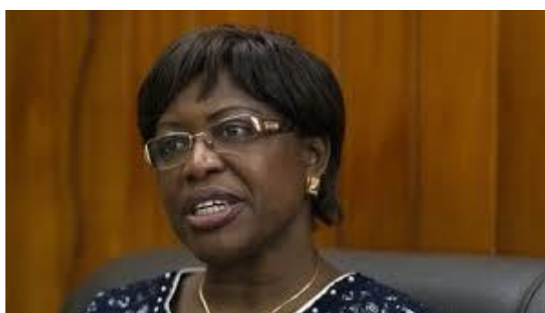
Mme Antoinette Montaigne

Mme Antoinette Montaigne, consultante sur les questions du vivre-ensemble, ancienne ministre de la Réconciliation nationale en Centrafrique a salué l'initiative portée par le Bénin. Elle a notamment déclaré : « Avec la crise dans mon pays, j'ai pris conscience de la montée dangereuse de tous types de préjugés et de l'intolérance. En tant que ministre de la Réconciliation, je me suis rendue compte qu'il en faut peu pour que les sociétés basculent. Je souhaite que l'Afrique centrale, zone perturbée par tous types de conflits, puisse s'inscrire dans la démarche du vivre ensemble ». Elle a lancé une Académie de la paix en Centrafrique qui ambitionne d'aller dans d'autres pays pour parler de l'éducation à la paix. Elle a déclaré être ravie de travailler notamment avec le Réseau de l'initiative africaine de l'éducation à la paix lancé par le Centre Panafricain pour la Prospective Sociale (CPPS) de l'institut Albert Tévoédjrè. Des classes de paix seront organisées en Centrafrique afin que « les élèves soient la pépinière de la paix demain en Centrafrique et en Afrique ».