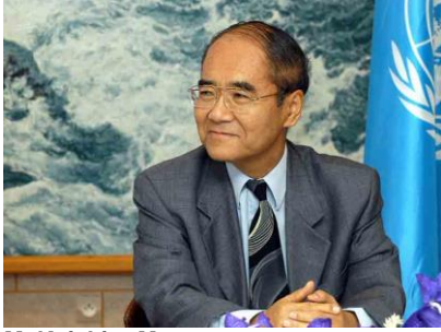
M. Koichiro Matsuura Directeur général de l'UNESCO de 1999 à 2009