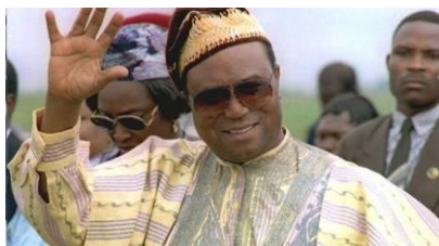
M. Nicéphore Dieudonné Soglo homme d'État béninois