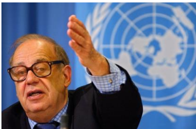
M. Jean Ziegler , homme politique altermondialiste et sociologue suisse