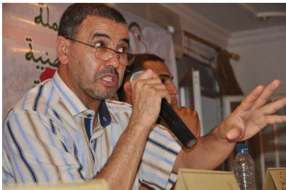
M. Saâdeddine El Othmani psychiatre et homme politique marocain