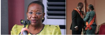
Mme Henriette Diabate femme politique de Côte d'Ivoire