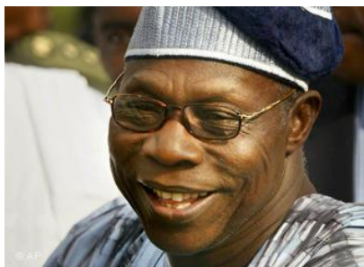
M. Olusegun Obasanjo homme d'État nigérian