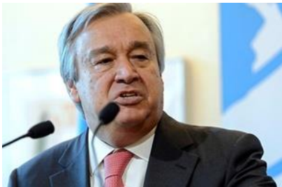
M. António Guterres , Haut Commissaire des Nations Unies pour les réfugiés entre Juin 2005 et Décembre 2015