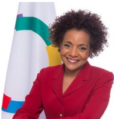
Mme Michaele Jean Secrétaire Générale de l'OIF