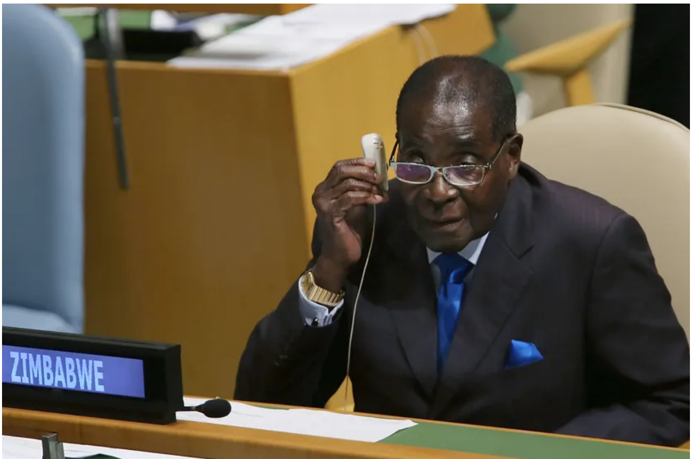
Robert Mugabe en septembre 2015 à l'Assemblée générale des Nations unies

Robert Mugabe est décédé à 95 ans. Il a dirigé le Zimbabwe pendant 37 ans avant d'être poussé à la démission en 2017. Père fondateur du pays pour les uns. Despote pour les autres. Jusqu'à en faire une caricature de ce népotisme souvent associé au continent africain.