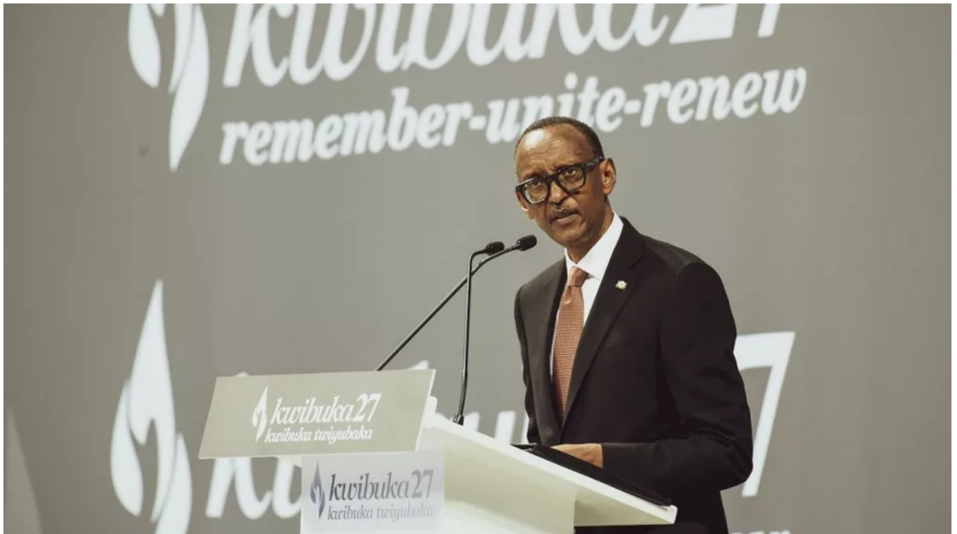
Paul Kagame prononce un discours, le 7 avril 2021 à Kigali, lors de la commémoration du 27e anniversaire du génocide au Rwanda.

Qui est Paul Kagame ? Redresseur du pays pour les uns, despote pour les autres. L'image que renvoie le président du Rwanda est au final très brouillée. Il est l'un des hommes politiques africains les plus en vue, même s'il est à la tête d'un tout petit pays.