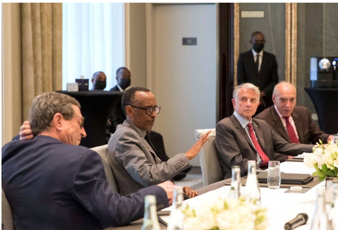
Paul Kagame entouré des généraux français Eric de Stabenrath (premier plan) et Jean Varret.

dans une immense salle de réunion, haute comme une nef de cathédrale, les visages se sont découverts et l'émotion fut d'emblée perceptible.