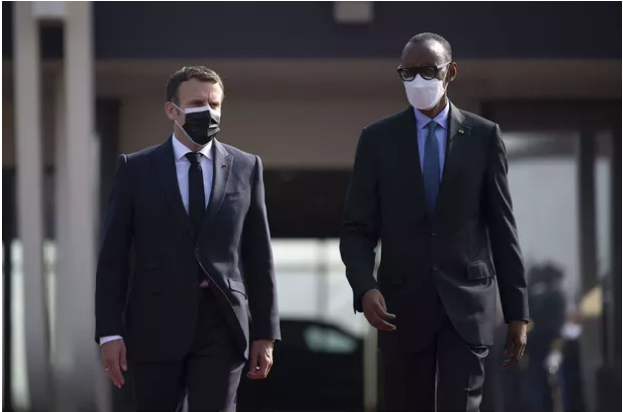
Emmanuel Macron et Paul Kagame à l'aéroport de Kigali, vendredi.