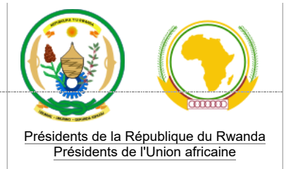
Présidents de la République du Rwanda Présidents de l'Union africaine

Après la démission de Pasteur Bizimungu le 23 mars 2000, Paul Kagame lui succède le lendemain comme président par intérim en tant que vice-président, avant d'être élu président de la République par le Parlement, le 17 avril suivant [22] . Il prête serment le 22 avril 2000 [23] . À la suite de l'instauration d'une nouvelle constitution par référendum, il est élu au suffrage universel direct le 25 août 2003 (95 % des voix).