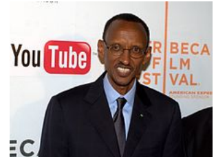
Paul Kagame en 2010.