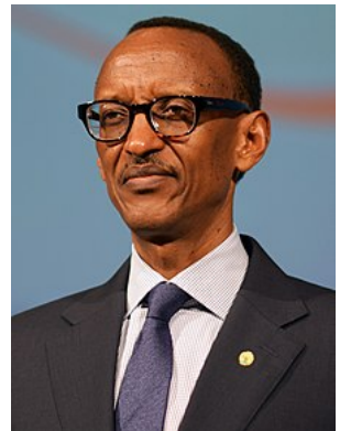
Paul Kagamé en 2014.