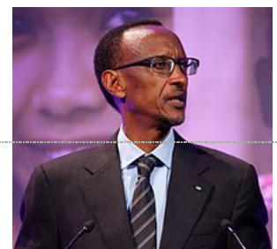
Paul Kagame, lors d'un sommet dédié à la planification familiale à Londres en 2012.