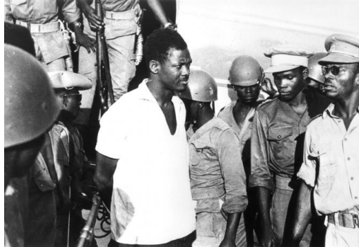
C'est l'une des dernières photos de Patrice Lumumba vivant. Ce 3 décembre 1960, l'ancien Premier ministre capturé au Katanga par les rebelles et par des mercenaires belges est livré aux soldats congolais. Il sera assassiné le 17 janvier 1961.