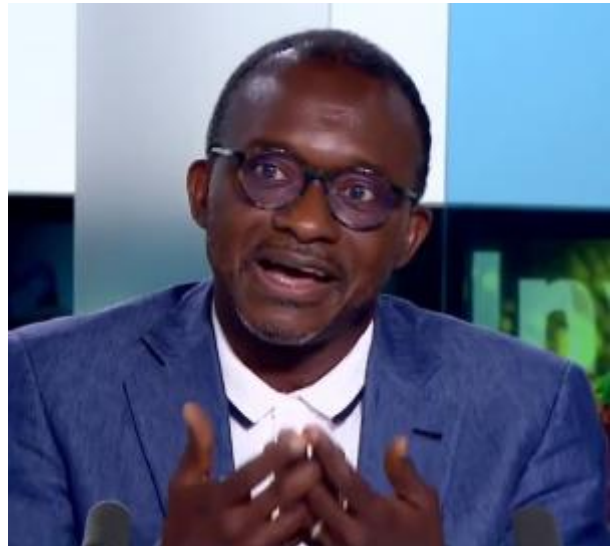
Alfred Tumba Shanga Lokoho.

Ce sont surtout ses discours qui parlent pour lui, davantage que l'action, car il n'a été Premier ministre que pendant à peine trois mois. Et on peut dire qu'il y avait une vision politique très claire, à savoir l'indépendance du Congo et de l'Afrique, la coopération entre les peuples et les pays sur un plan d'égalité et surtout, ce qui commençait à se profiler : le non-alignement.