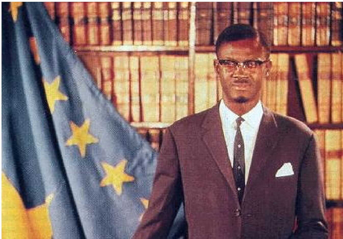
Portrait officiel de Patrice Lumumba, Premier ministre congolais, en juin 1960.

promettant un monument à la hauteur de son aura ! Il va ensuite intégrer des lumumbistes au sein de son parti, le Mouvement populaire de la révolution (MPR), au point de les étouffer.