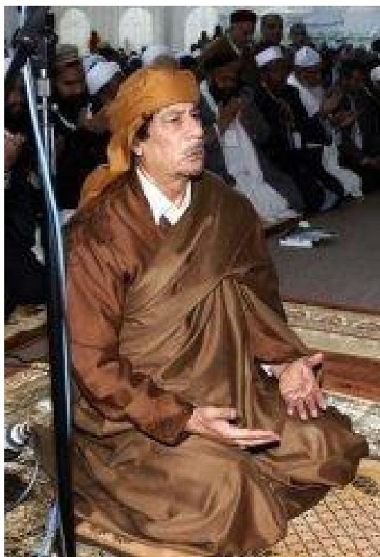
Le colonel Kadhafi à Tripoli, le 13 février 2011