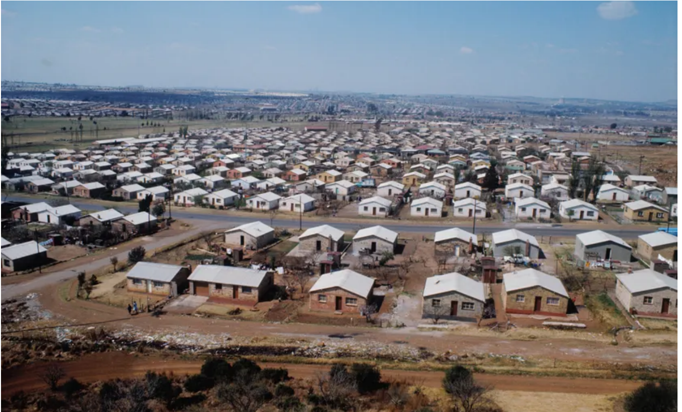
Maisons du township de Soweto, en septembre 1975

“ Elle se dit: "Puisque ma musique est au plus haut, ou au plus loin, je vais aller aux Nations Unies. Dire qu'il y a un Etat sur lequel tout le monde ferme les yeux parce que ça arrange tout le monde, mais où la situation est absolument inique, injustifiable, injustifiée. Il faut changer."