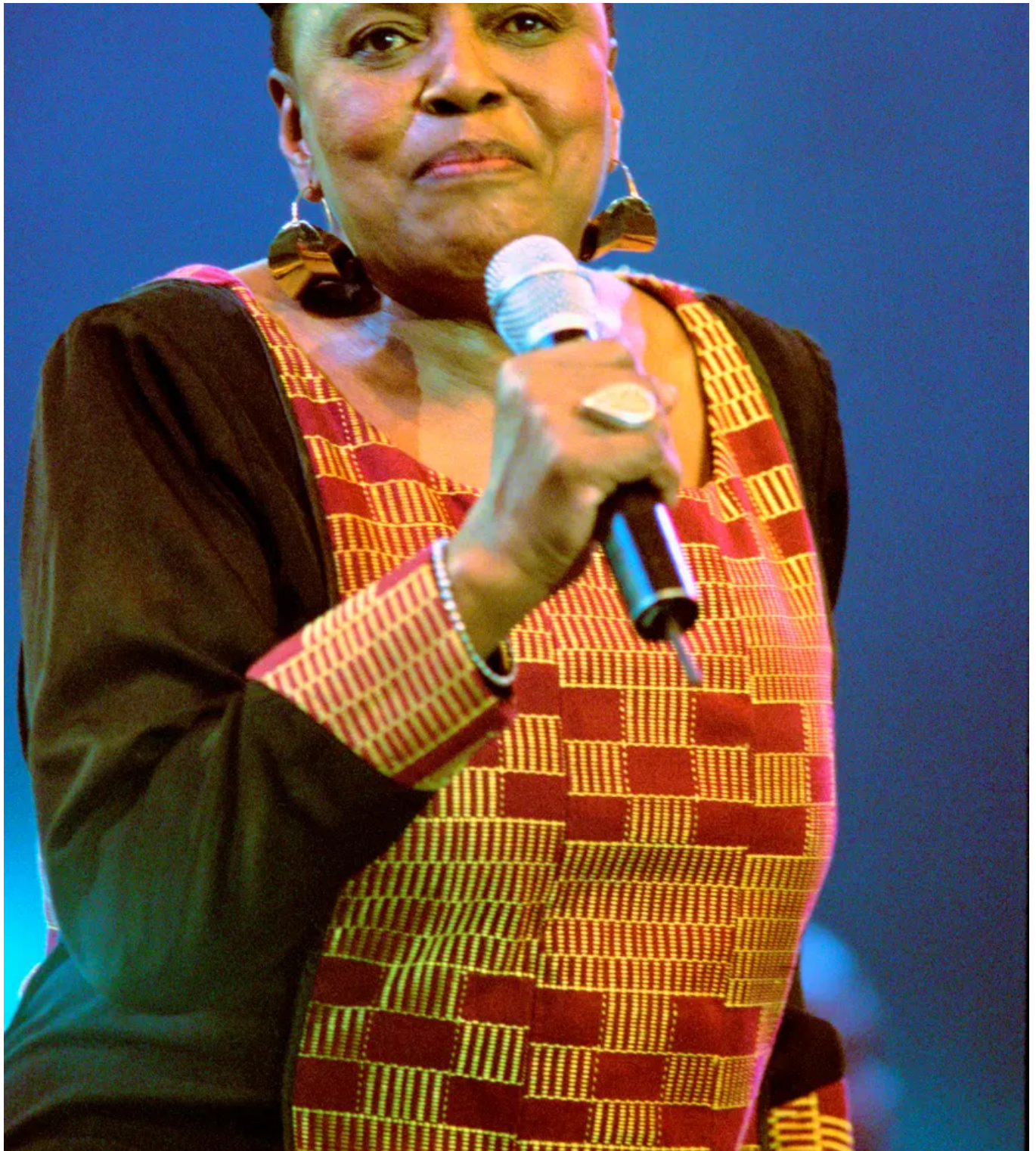
Miriam Makeba en concert à la Hague, le 14 juillet 2001