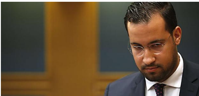
Alexandre Benalla hospitalisé : toujours en réanimation ce mercredi, les infos