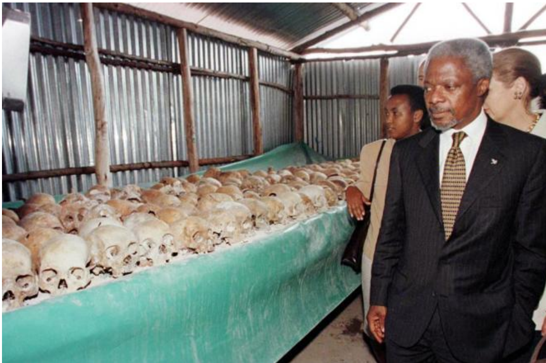
Kofi Annan au Centre du mémorial du génocide de Mulire (Rwanda), en mai 1998.

Nouvel échec de celui qui est devenu le responsable des opérations de maintien de la paix : le génocide du Rwanda. Là encore, Kofi Annan reconnaîtra quelques années après les erreurs commises par l'ONU, lors d'un discours devant le Parlement rwandais, en 1998 : « Aujourd'hui, nous savons que ce que nous avons fait alors était loin d'être suffisant ; pas assez pour protéger le Rwanda contre lui-même, pas assez pour honorer les idéaux pour lesquels les Nations unies existent. »