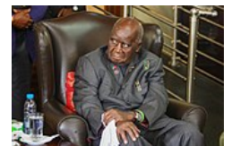
Kenneth Kaunda en 2020.

Après sa retraite, il a été impliqué dans diverses organisations caritatives. Sa contribution la plus notable a été son zèle dans la lutte contre la propagation du VIH/sida . Un des enfants de Kaunda a été atteint par la pandémie dans les années 1980.