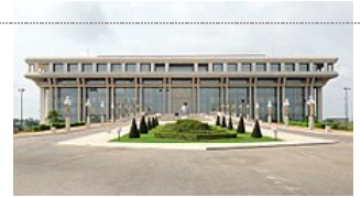
Le siège de la Fondation Félix-Houphouët-Boigny, à Yamoussoukro.