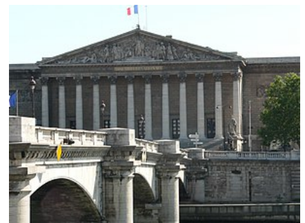
Le palais Bourbon, siège de l'Assemblée nationale française.

Après l'adoption de la constitution de la IV e République, il est réélu sans difficulté avec 21 099 voix sur 37 888 des suffrages exprimés 2 . Toujours membre de la Commission des territoires d'outre-mer (dont il devient secrétaire en 1947 et 1948), il est nommé, en 1946, à la Commission du règlement et du suffrage universel 2 . Le 18 février 1947, il propose de réformer en profondeur le système des conseils généraux des territoires de l'AOF, de l'AEF et du Conseil fédéral afin qu'ils soient plus représentatifs des populations autochtones 2 . Il réclame également, à de nombreuses reprises, la création d'assemblées locales en Afrique afin que les indigènes puissent faire l'apprentissage de leur autonomie et de la gestion 2 .