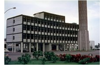
Siège de la RTI.