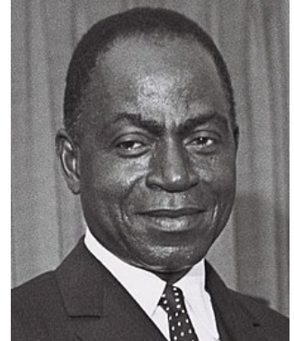
Félix Houphouët-Boigny en 1962.