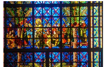
Détail d'un vitrail de la basilique Notre-Dame-de-la-Paix de Yamoussoukro, sur lequel Félix Houphouët-Boigny est représenté en dessous de Jésus.