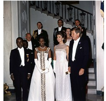
Félix Houphouët-Boigny et son épouse Marie-Thérèse Houphouët-Boigny avec John F. Kennedy et Jackie Kennedy en 1962