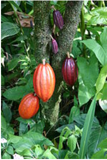
Un cacaoyer avec les gousses de fruits à différents stades de maturation.

Le 26 octobre 1925 6 , Houphouët commence sa carrière en tant que médecin-auxiliaire à l'hôpital d'Abidjan 8 où il fonde une « Amicale » regroupant le personnel médical indigène 4 . L'entreprise tourne court ; l'administration coloniale voit d'un très mauvais œil cette association qu'elle assimile à une formation syndicale 4 et décide de le muter, le 27 avril 1927 6 , au service de Guiglo où les conditions sanitaires sont particulièrement éprouvantes 9 . Toutefois, faisant preuve de véritables aptitudes professionnelles, il est promu à Abengourou, le 17 septembre 1929 6 , à un poste réservé, jusque-là, aux Européens 4 .