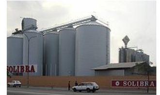
Brasserie Solibra à Abidjan

De fortes agitations sociales secouent alors le pays, créant un véritable climat d'insécurité 71 . L'armée se mutine en 1990 et 1992, et le 2 mars 1990 des manifestations contestataires sont organisées dans les rues d'Abidjan avec des slogans, jusque-là inédits, tels que « Houphouët voleur » et « Houphouët corrompu » 3 . Ces manifestations populaires obligent le président à lancer une démocratisation du régime aboutissant, le 31 mai, à l'autorisation du pluralisme politique et syndical. Lors de l'élection présidentielle du 28 octobre 1990, le « vieux » est confronté, pour la première fois, à un adversaire, Laurent Gbagbo 74 . Cela ne l'empêche pas, pour autant, d'être réélu pour un septième mandat avec 81,68 % des suffrages 74 , au grand dam de son opposant du FPI qui, dénonçant une manipulation du Code de la nationalité, réclame la différenciation nette entre nationaux et étrangers émigrés, dans la mesure où ces derniers disposent pratiquement des mêmes droits civiques, politiques et sociaux que ces premiers, et offrent quasi automatiquement leurs suffrages à leur protecteur : Houphouët-Boigny 75 . Gbagbo va même plus loin, en revendiquant une reconnaissance juridique des droits des nationaux sur la terre, remettant en cause les propriétés acquises, depuis des décennies, par les planteurs burkinabés dans l'Ouest et le Sud-Ouest forestier 75 .