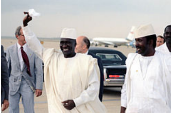
Le président guinéen Ahmed Sékou Touré

En octroyant l'indépendance à la Guinée par le « non » au référendum du 28 septembre 1958, Ahmed Sékou Touré a non seulement défié le général de Gaulle mais aussi le tenant du « oui » africain, Houphouët-Boigny 29 . Il opère donc immédiatement une mise en quarantaine de Conakry et l'exclusion du Parti démocratique guinéen du RDA 111 . Les tensions sont telles entre les deux hommes qu'il fomente en coopération avec le SDECE des complots contre le régime de Sékou Touré 112 ; en janvier 1960, Houphouët-Boigny livre en masse des armes aux anciens rebelles de la région de Man, et incite, en 1965, ses homologues du conseil de l'Entente à prendre conjointement part à une tentative de renversement 113 . En 1967, il suscite la création du Front national de libération de la Guinée (FNLG), véritable réserve d'hommes prêts à contribuer à la chute de Sékou Touré 114 . S'il ne parvient jamais à le renverser, le dirigeant ivoirien ne lui pardonne cependant jamais son « non », et déclare même à son sujet en 1966 :