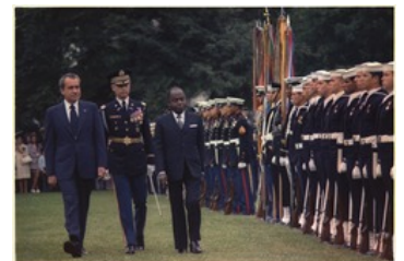
Félix Houphouët-Boigny, lors d'une cérémonie officielle d'arrivée aux États-Unis avec Richard Nixon le 9 octobre 1973.