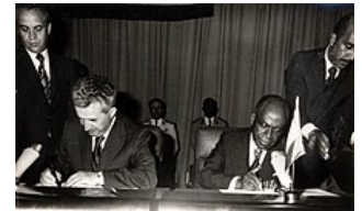
Félix Houphouët-Boigny et Nicolae Ceaușescu en 1977