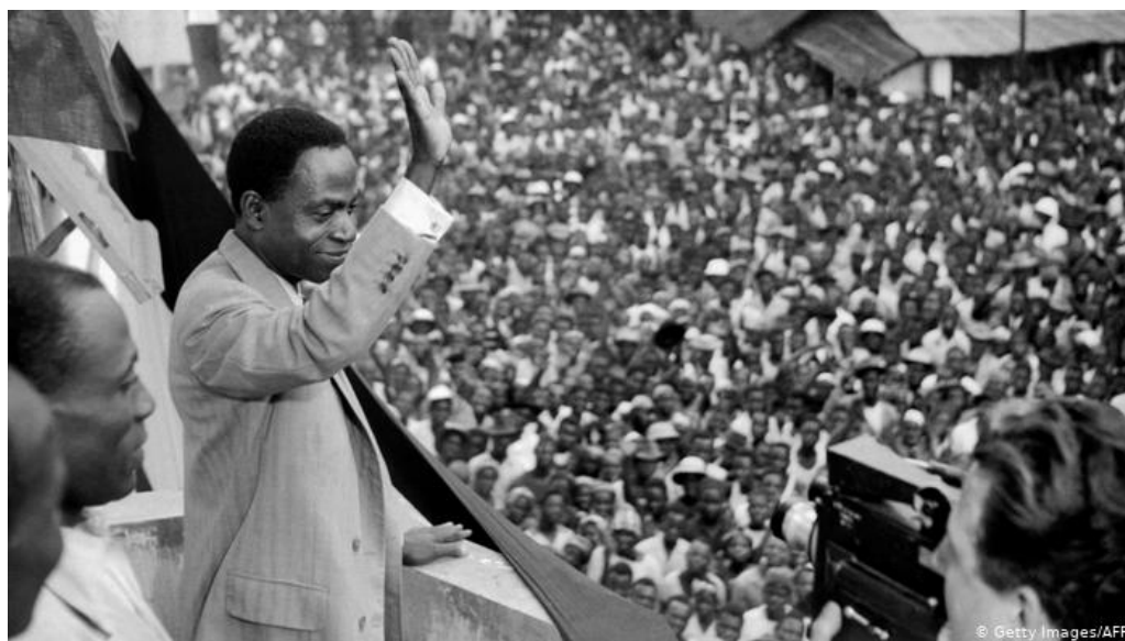
Félix Houphouët Boigny en 1945, dans une cité ouvrière au sud d'Abidjan

Premier président après l'indépendance, Félix Houphouët-Boigny a régné pendant 33 ans en maintenant son attachement à la France.