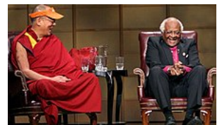
Le 14 e dalaï-lama et Desmond Tutu à Vancouver (Canada), en 2004.