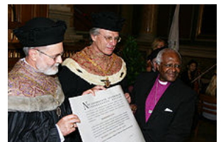
Desmond Tutu recevant son doctorat honoris causa de l'université de Vienne.